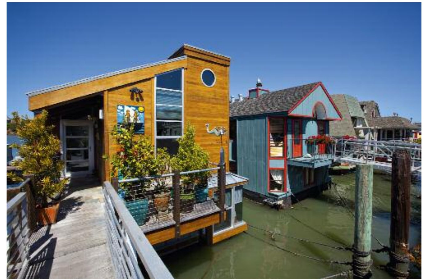
▲ De l'autre côté du pont, Sausalito, coquettes house-boats sur l'eau, rues-pontons à fleurs et plantes en pots, déborde de charme et de poésie.