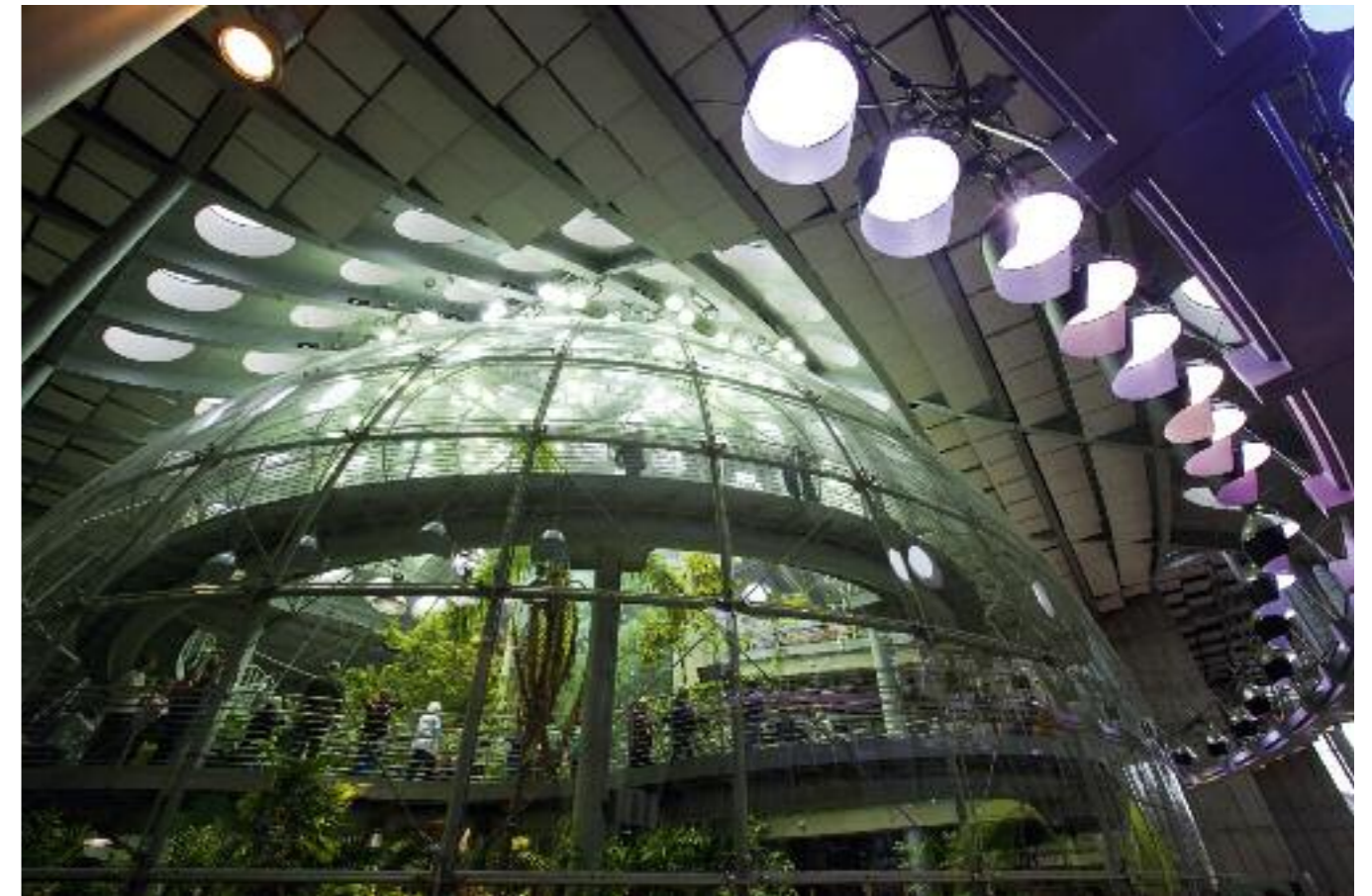
▲ La California Academy of Sciences (2008), de l'architecte Renzo Piano, abrite une forêt tropicale à l'intérieur d'une immense sphère.