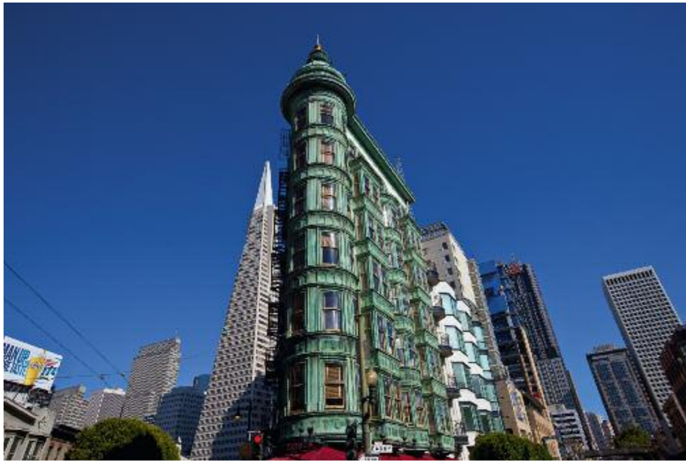
▲ La patine verte donne une gueule folle au Sentinel Building (1906) où, en 1972, Francis Ford Coppola a établi ses studios Zoetrope. ▼