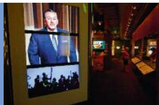
Walt Disney Family Museum IL ÉTAIT UNE FOIS LE CARTOON