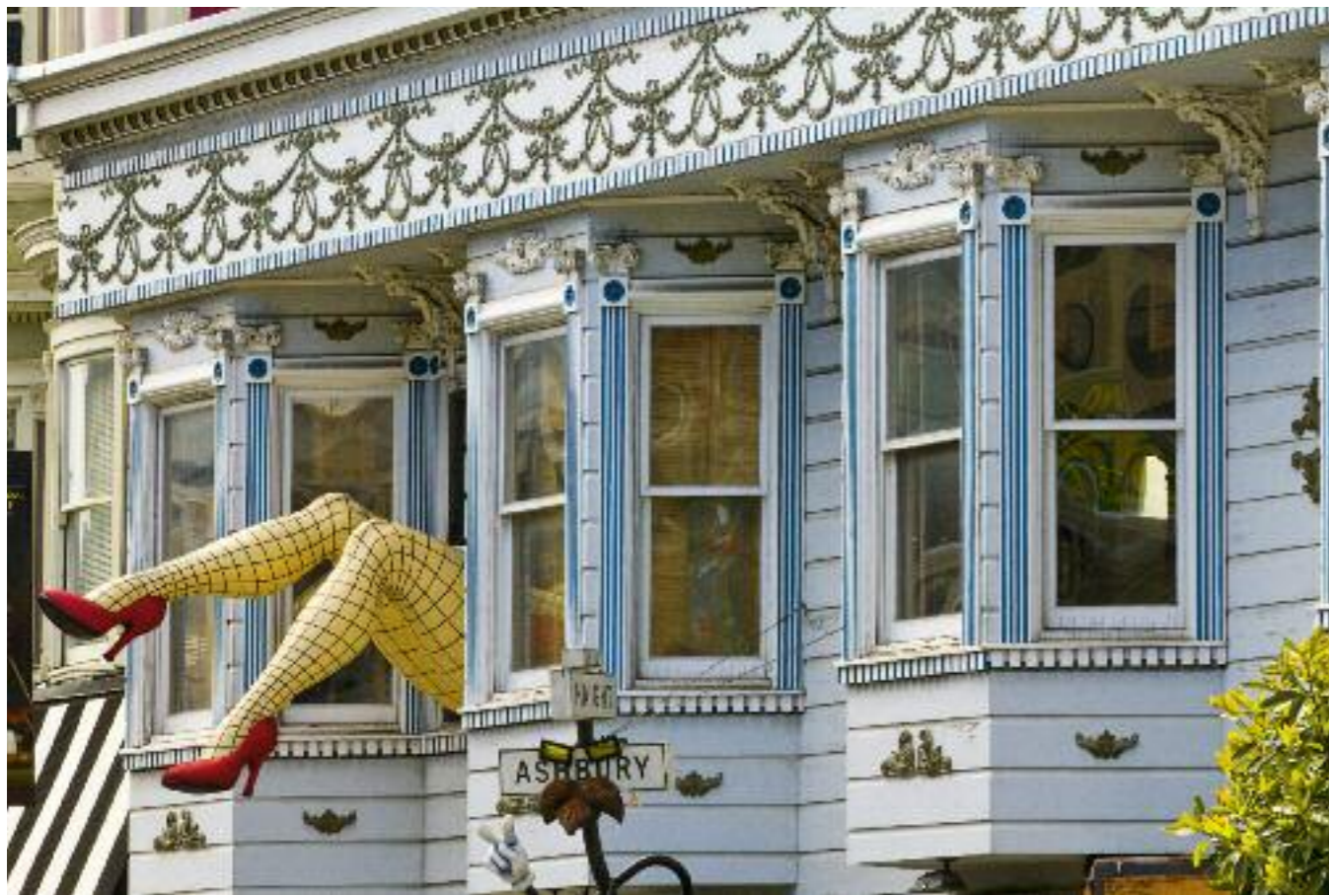
▲ Sur Haight Street, deux jambes font office d'enseigne pour une boutique de déguisements.