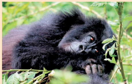
Un captivant voyage à la rencontre des gorilles du Rwanda.