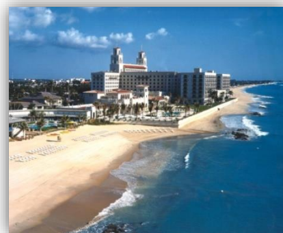
The Breakers, Palm Beach

Hôtels boutiques : The Colony Hotel (classé AAA 4 diamond) / Seagate Hotel & Spa (situé sur Delray Beach) / The Brazilian Court Hotel & Beach Club (à quelques pas de Worth Avenue)