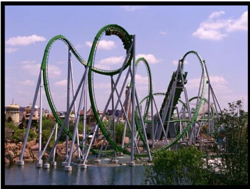
Hulk Coaster, Islands of Adventure

Avec 4 parcs à thème et 2 parcs aquatiques signés Walt Disney World Resort , Orlando s'est créé une belle notoriété. A voir : Magic Kingdom, Epcot, Animal Kingdom, Disney's Hollywood Studios, mais aussi Blizzard Beach et Typhoon Lagoon.