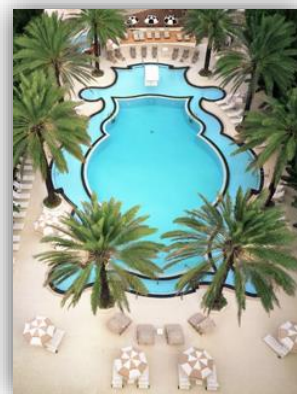
Raleigh Hotel, Miami

District Art Déco : Anglers Boutique Hotel / Raleigh Hotel / Sagamore Hotel (South Beach) / Daddy O (Bal Harbour) / Solé Hotel (Sunny Isles)